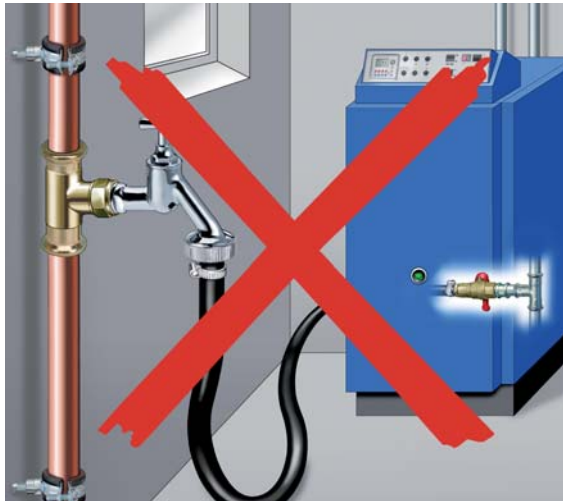
Nicht mehr zulässig! 1)